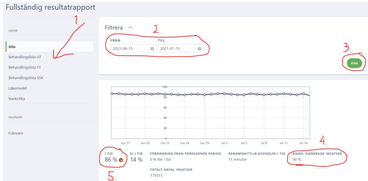
Fig 1. Illustration av hur man tar fram fullständig rapport.

Legitimerad personal lägger ett tidsspann för när insatsen kan utföras. Om insatsen ofta utförs "ej i tid" kan tidsspannet behöva justeras om det visar sig inte fungera utifrån brukarens behov.