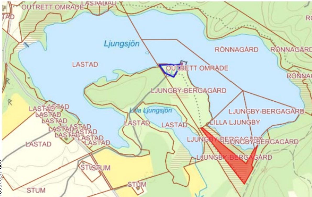
Ljungby-Bergagård 1:2 Falkenberg