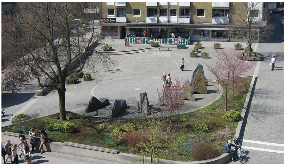
Restauranger, uteserveringar, sittplatser är viktiga inslag för livet i staden.

Policyn antas av kommunfullmäktige och ska ses som ett levande dokument med återkommande revideringar.