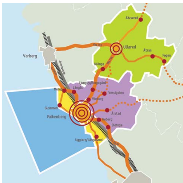
Strukturplan ur förslag till Översiktsplan 2.0. Bilden illustrerar viktigare stråk och tätorter.