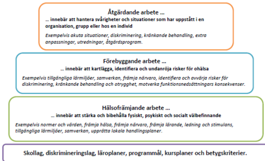
Bilaga 1. Det hälsöfrämjande och förebyggande uppdraget

Utifrån barn- och elevhälsoplanen, och som nämndes i kontrollmålet ovan, framgår att målet för barn- och elevhälsoarbetet 2018/2019 är att utveckla och stärka barn- och elevhälsoarbetet inom förskola/skola med fokus på det hälsöfrämjande och förebyggande arbetet. Som nämnts tidigare ska det bland annat tas fram kommunövergripande plan med rutiner för främjande av närvaro, samt skriftliga rutiner lokalt på varje enhet för arbetet kring att främja närvaro. De nya rutinerna ska förankras hos berörd personal.