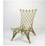
Marcel Wanders, född 1963 (NL)

ut. Zaven har ett nära samarbete med lokala, italienska hantverkare, som producerar deras design.