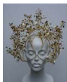
Lamija Suljevic (SE)

Samtidigt, i och med verkets titel, finns fortfarande en koppling till jordbrukssfären kvar.