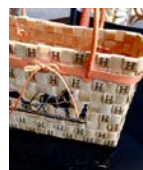
Aia Jüdes, född 1979 (SE)

Cast away animals uppstod i viljan att göra någonting av restprodukter av trä från studion. Tolstrup kallar sig för Studiomama och arbetar med möbler och produktformgivning. Vid flera tillfällen har hon använt och arbetat med material från lastpallar till enskilda möbler och hela möbelkoncept.