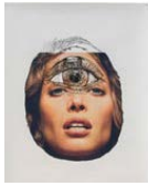
M/M Paris (FR)

estetiska värden. Hon var en av de första designers som gjorde sk "customized design", dvs gjorde om befintligt mode som med skorna och handskarna i utställningen. Genom att dekonstruera och addera har hon höjt föremålen till en annan nivå och gjort dem unika.