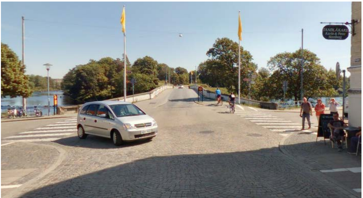
Bild mot Tullbron

Yttrande polisen: Polisens erfarenhet av korsningen Brogatan/Ågatan/Hamngatan är att det ofta kan vara svårt att se trafiken som kommer från vänster när man kommer på Ågatan mot Brogatan. Att man får företräde skulle underlätta för den trafikant som kör ut på Brogatan från Ågatan. Polisen tillstyrker förslaget om att högerregeln ska gälla.