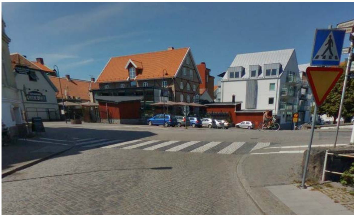
Bild från Hamngatan