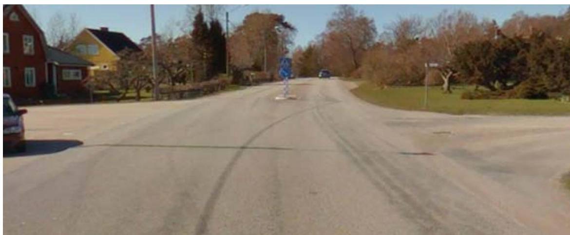
Golfvägen in till höger, riktning från Skrea kyrka