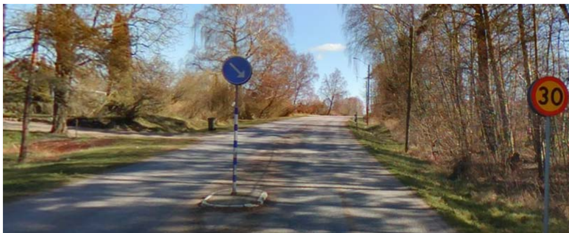
Riktning mot Skrea kyrka