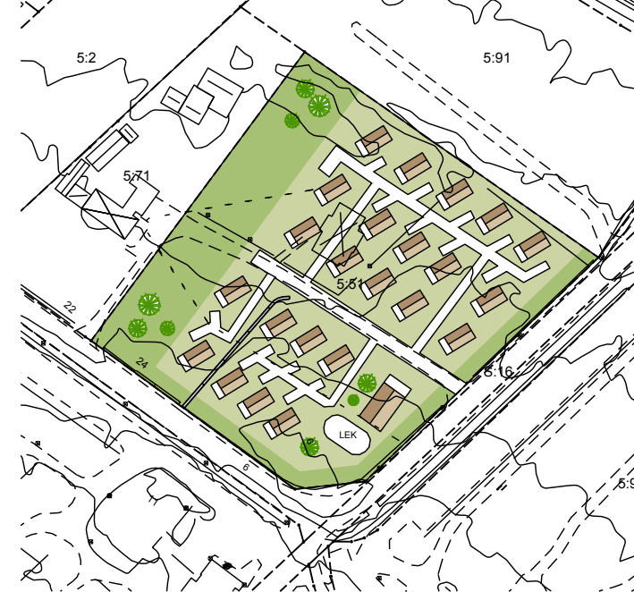
Skala 1:2000 (A3)