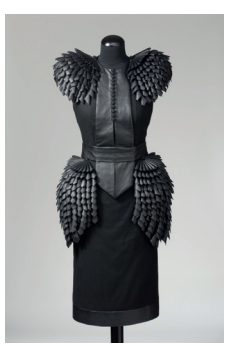
Helena Hörstedt: Klänning Broken Shadow