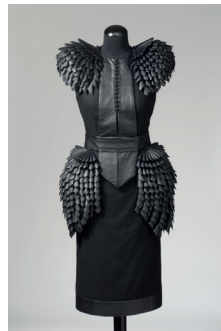
Helena Hörstedt: Klänning Broken Shadow