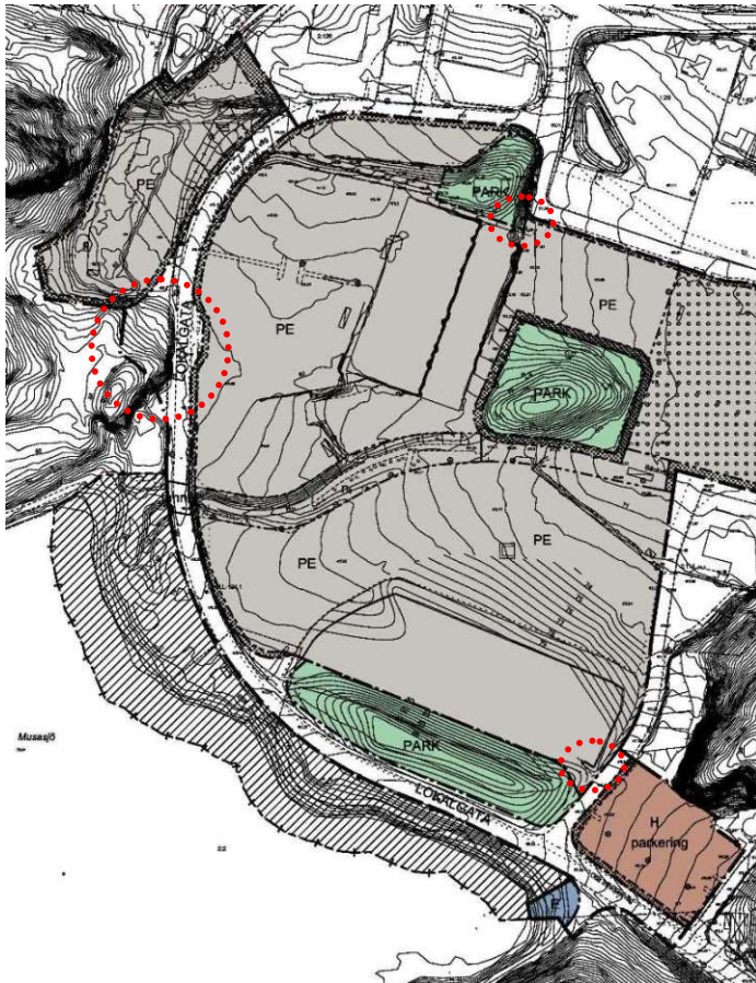
Bild 9. Utdrag plankarta, förändringar av allmän platsmark gentemot gällande detaljplan.

Föreliggande detaljplan föreslår ändring (utökning/minskning) av tidigare planlagd allmän platsmark inom områden som är markerade med röda cirklar på ovanliggande kartskiss samt inom det område där tidigare detaljplan upphävs. Huvudman för den ändrade allmänna platser såsom lokalvägar, natur, mm (inklusive dess dagvattenhantering) inom detaljplanen förutsätts bli Ullareds centrums samfällighetsförening, vilket sker genom att den befintliga gemensamhetsanläggningen Ullared Ga:3 omprövas till att även omfatta all tillkommande allmän platsmark inom detaljplanen. Förvaltningsansvaret för sådan mark som utgår ur gemensamhetsanläggningen Ullared Ga:3 övergår till dess markägare (gäller framförallt mark mot Musasjö där tidigare detaljplan upphävs).