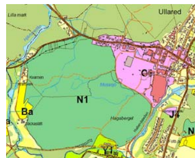
Bild 2. Utdrag från delöversiktsplanen för Ullared.

I kommunens översiktsplan är området utpekat som befintlig tätorts- och bostadsbebyggelse. I delöversiktsplanen för Ullared anges markanvändningen till centrumfunktioner (C1) samt natur och friluftsliv (N1), se karta till höger.