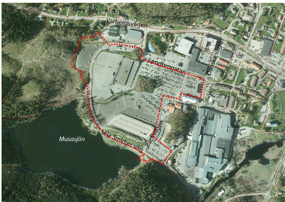
Bild 1. Flygfoto (2012) över handelsområdet. Röd linje indikerar planförslagets avgränsning.

Planområdet är beläget i Ullared och utgörs av befintliga parkeringsanläggningar till omgivande handel. Området avgränsas i stort av befintliga lokalgator inom handelsområdet. Planområdet är cirka 10 ha stort.