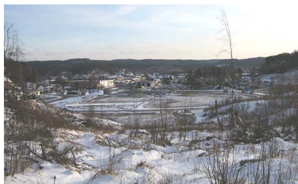
Bild 4 och 5. Miljöbilder på omgivande landskap. Del av Musasjön på bild till vänster.