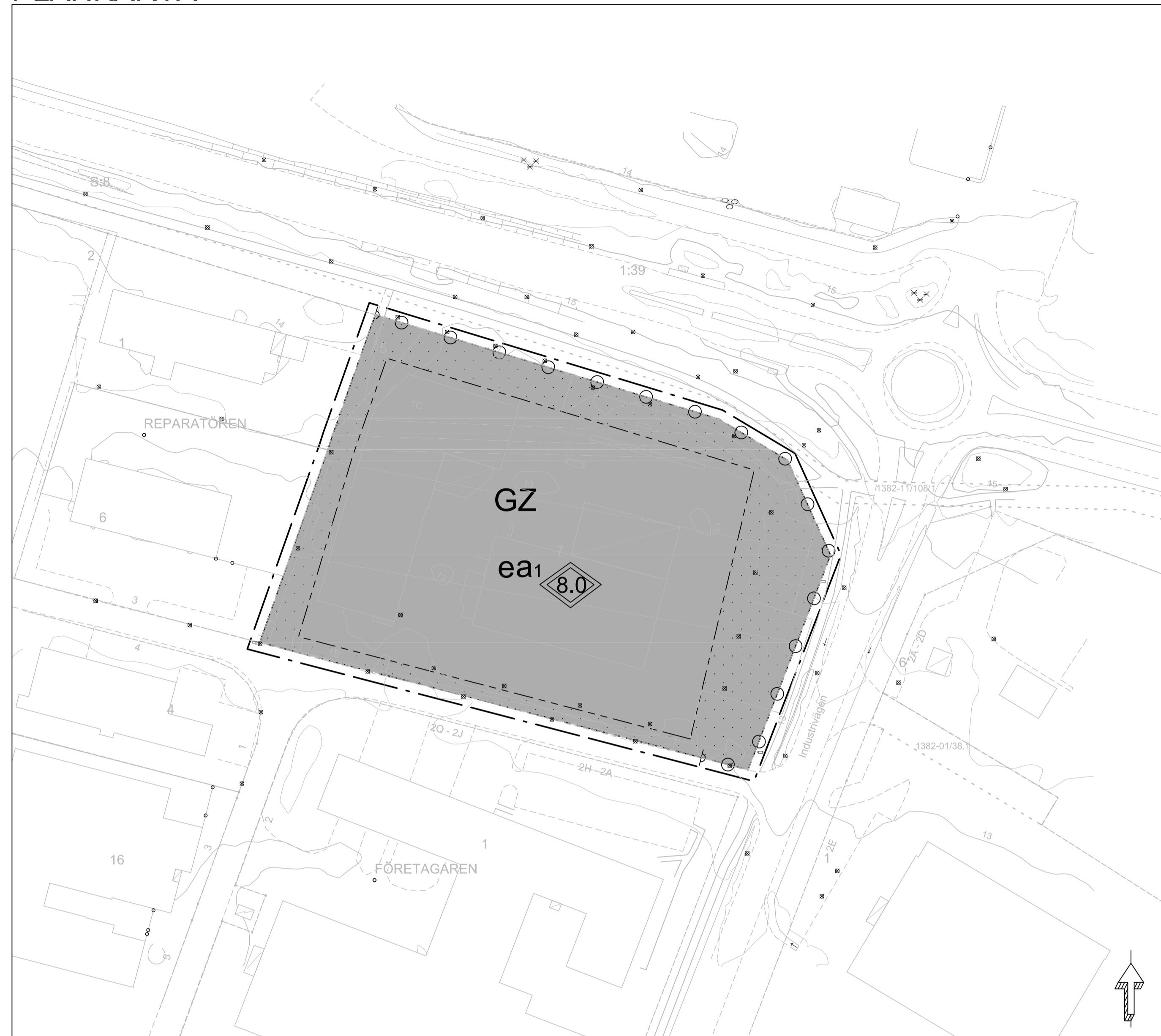
Skala 1:1000 (A3)