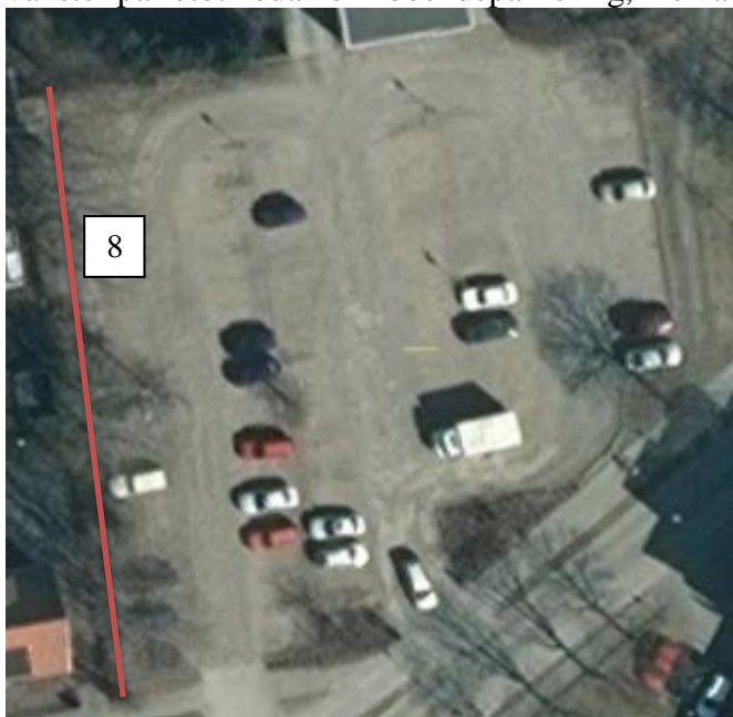
Parkering vid röd markering 8 föreslås bli boendeparkering.

Boendeparkering på centrumgatorna undviks eftersom vi vill ha större omsättning på parkeringen på dessa gator för att gynna handeln. Förslaget är därför boendeparkering på grusparkeringen i anslutning till kvarteret Skärdegen där det får plats ett 70-tal fordon. Eftersom även andra parkeringsplatser försvinner som exempelvis gymnasieskolans parkering som inte är boendeparkering föreslås att inte hela grusparkeringen blir boendeparkering utan endast en rad. Stadsbyggnadskontoret föreslår att raden längst till vänster på fotot nedan blir boendeparkering, men att även annan parkering är tillåten där.