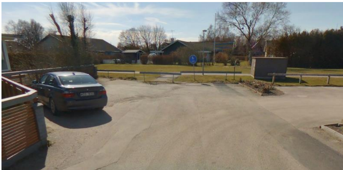
Vändplatsen med infart till parkering till höger.