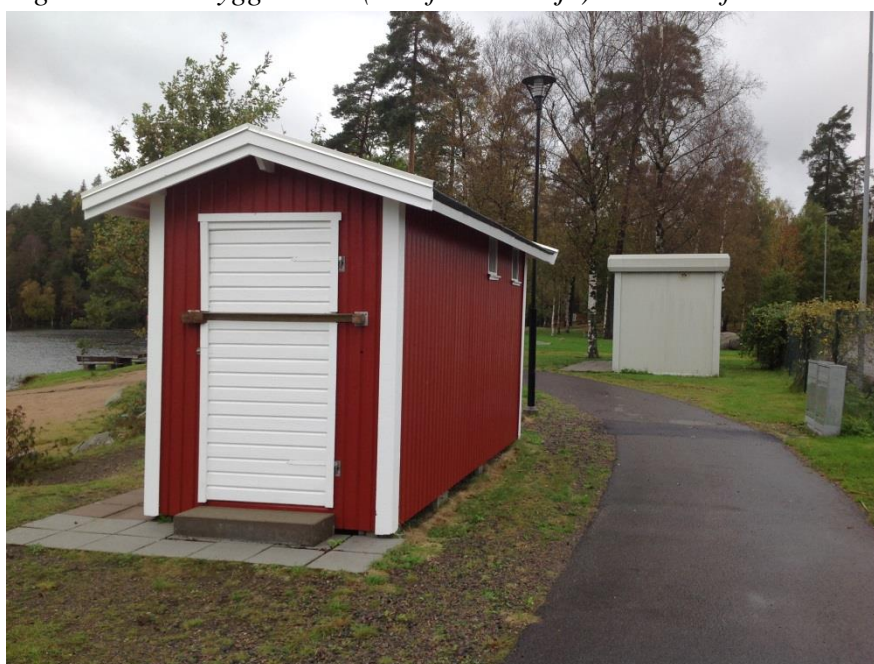
Figur 4. De två mindre byggnaderna norr om Musasjön.