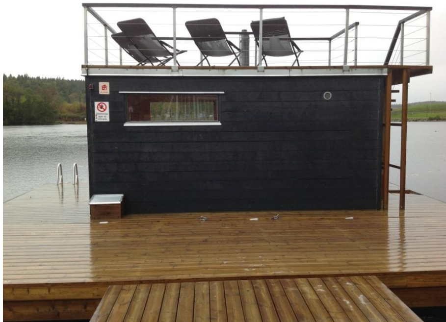
Figur 2. Bastuflotte