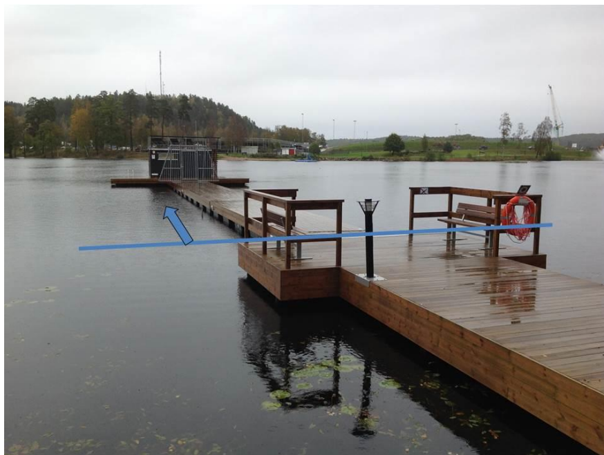
Figur 3. Yttre bryggsektion (utanför blå linje) och bastuflotte