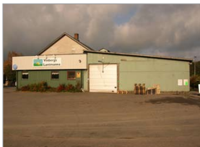
Ovan: Lantmanna från sydväst. Under: Från norr.

inrymmer numera också butiksförsäljning av produkter för lantbruket såsom foder, utsäde, gödsel, järnartiklar, trädgårdsvaror m.m. Tornet på taket påbyggdes på 1970-talet för upptransport av säd och används i samband med rensning av utsäde.