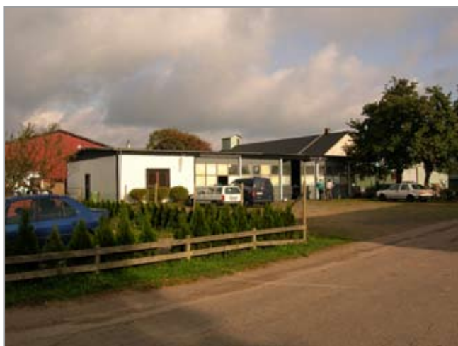
Garaget sett från väster.

Andra verksamhetsbyggnader i området är bl.a. ett f.d. bussgarage vid Pärönvägens slut och en ekonomibygnad mittemot, där det funnits ett hönseri. Det tillhörande bostadshuset i egenartad byggnadsstil sägs vara uppfört med inspiration från Amerika.