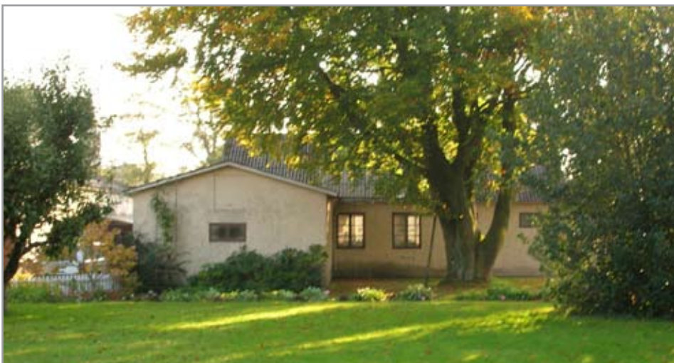
Överst: Del av skolområdet i Vinbergs kyrkby med skolhuset från 1914 i fonden. Till vänster: Hällebergsvägen i Vinbergs kyrkby. I byggnaden har funnits ett snickeri.

Under 1900-talets första decennier var järnvägen viktig för virkestransporter från skogsbygderna i inlandet mot kusten. Därefter övertogs transporterna av lastbilstrafiken. Åkerirörelsen blev en betydelsefull näring för Vinberg. Exempel på andra tidigare verksamheter i bygden är stenhuggeri och hästuppfödning under decennierna kring förra sekelskiftet. I kyrkbyn fanns en skofabrik. Betongindustrin på Vinbergs hed startade på 1960-talet och blev bygdens största industri. Vinbergs samhälle hade tidigare många bu-