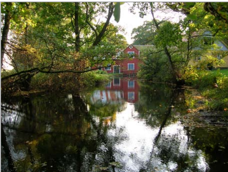
Ovan: Kvarnen vid Vinbergs kyrka. Till höger: Bygdegården i kyrkbyn.