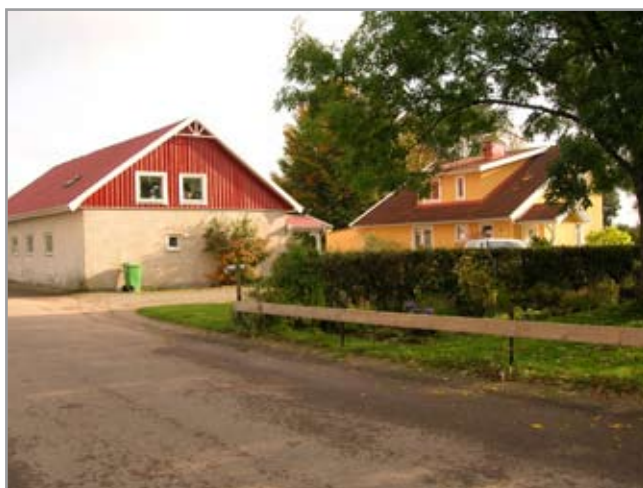
Det f.d. hönseriet till vänster.