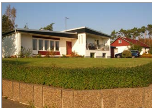
Till vänster och överst till höger: Hedvägen. Mitten till höger: Ringare-Gustafs väg med gaveln mot Hedvägen. Till höger: Vinbovägen.