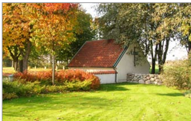
Bårhuset från sydöst.