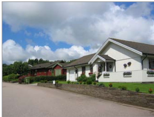
Fru Vinas väg, nordsidan.

Områdets sydvästra del domineras av den typiska 1970-talsvillan i 1,5 plan med brant sadeltak täckt med mörka betongpannor och en så kallad joddarbalkong åt ena gaveln. Fasadmaterialen är till övervägande del tegel.