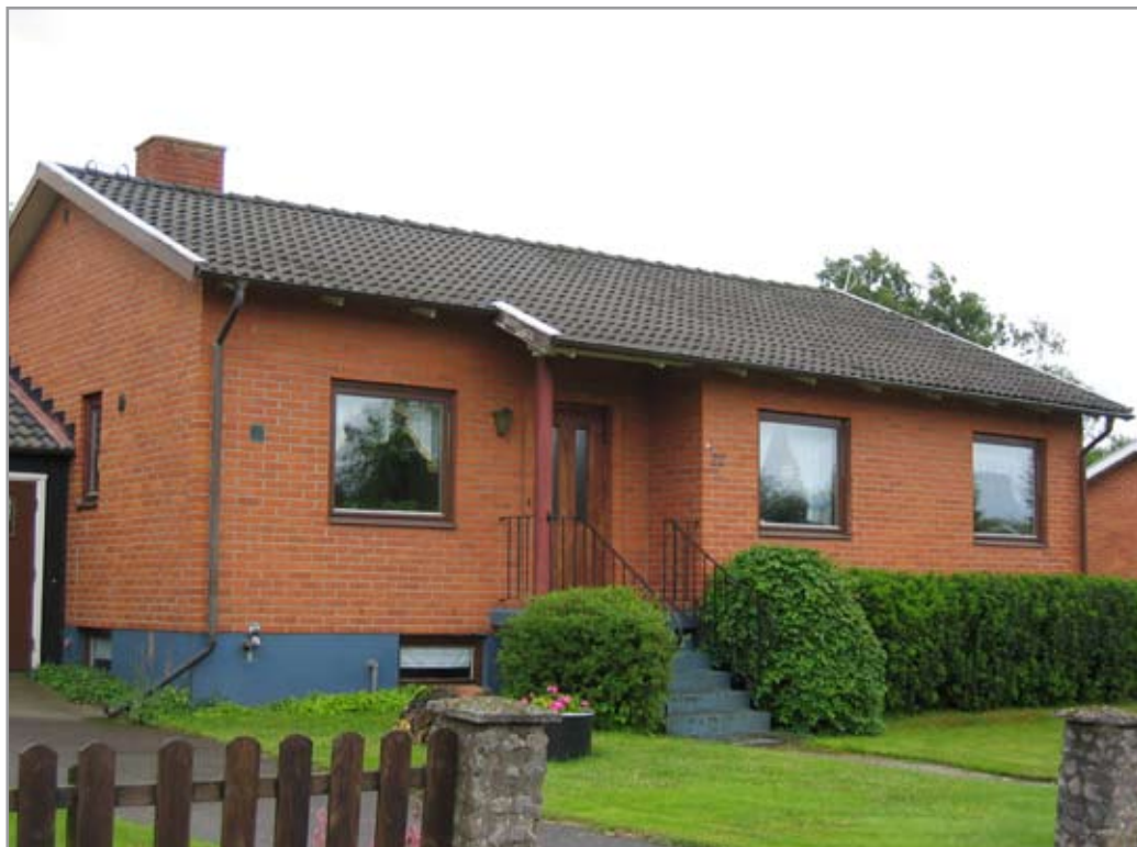
Vidablicksvägen, Tröinge 4:61.

Husen har en särpräglad 1960-talsarkitektur med sadeltak täckta med tegel- eller betongpannor, tegelfasader och enluftsfnster. Av de enfamiljshus som byggdes under 1960-talet i Sverige var cirka 90 procent enplansvillor av den typen som finns på övre Tröingeberg. Som fasadmateriel var teglet det klart dominerande.