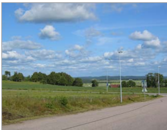
Utsikt mot öst.