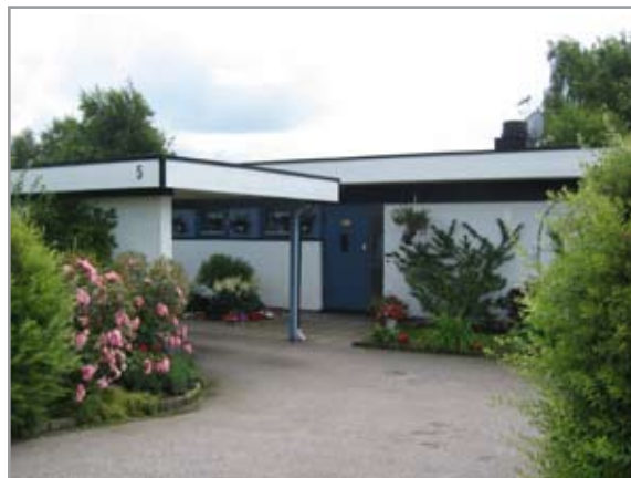
Hagmarksvägen, södra sidan.