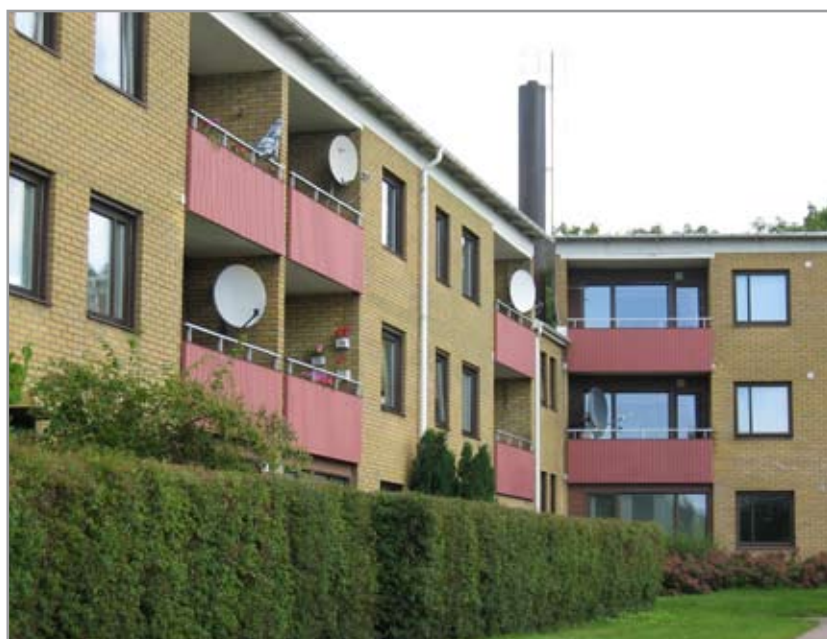
Tröingebergsvägen från söder.