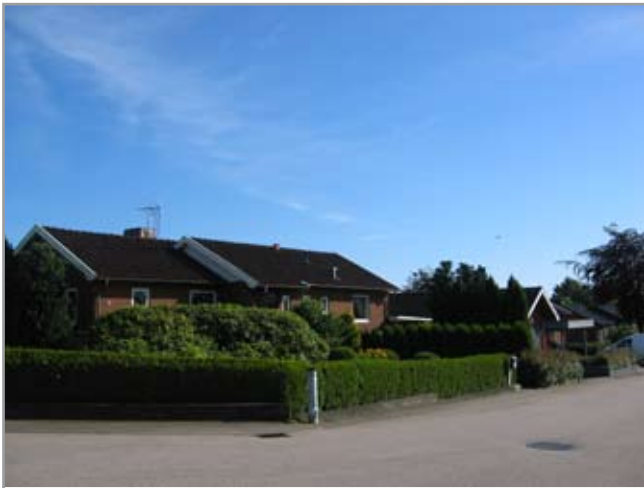
Hörngrensvägen, Tröinge 4:99.