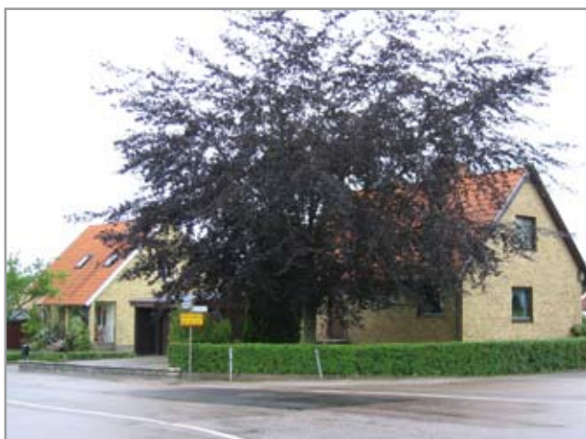
Vidablicksvägen, Tröinge 4:58 och 4:57.

De flesta husen har en rektangulär grundform och en enhetlig placering på de relativt små tomterna. I sydväst dominerar 1,5 plans-husen med relativt branta sadeltak medan de flesta husen österut är enplansvillor med flackare sadeltak.