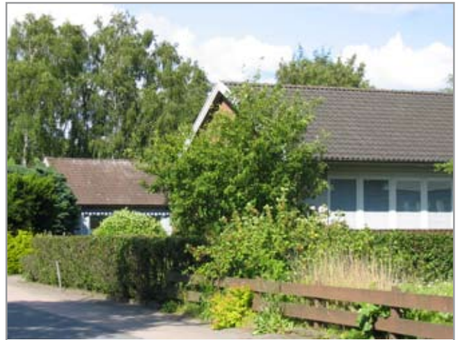
Gökvägen, Tröinge 4:148 och 4:149.

Övervägande del av husen i området är så kallade kataloghus som uppfördes under 1960-talet. Eksjö hus är troligen det som dominerar. Exempel är Tröinge 4:63 och Tröinge 4:99 (se foton ovan) som båda är Eksjö hus och byggdes 1959 respektive 1961.