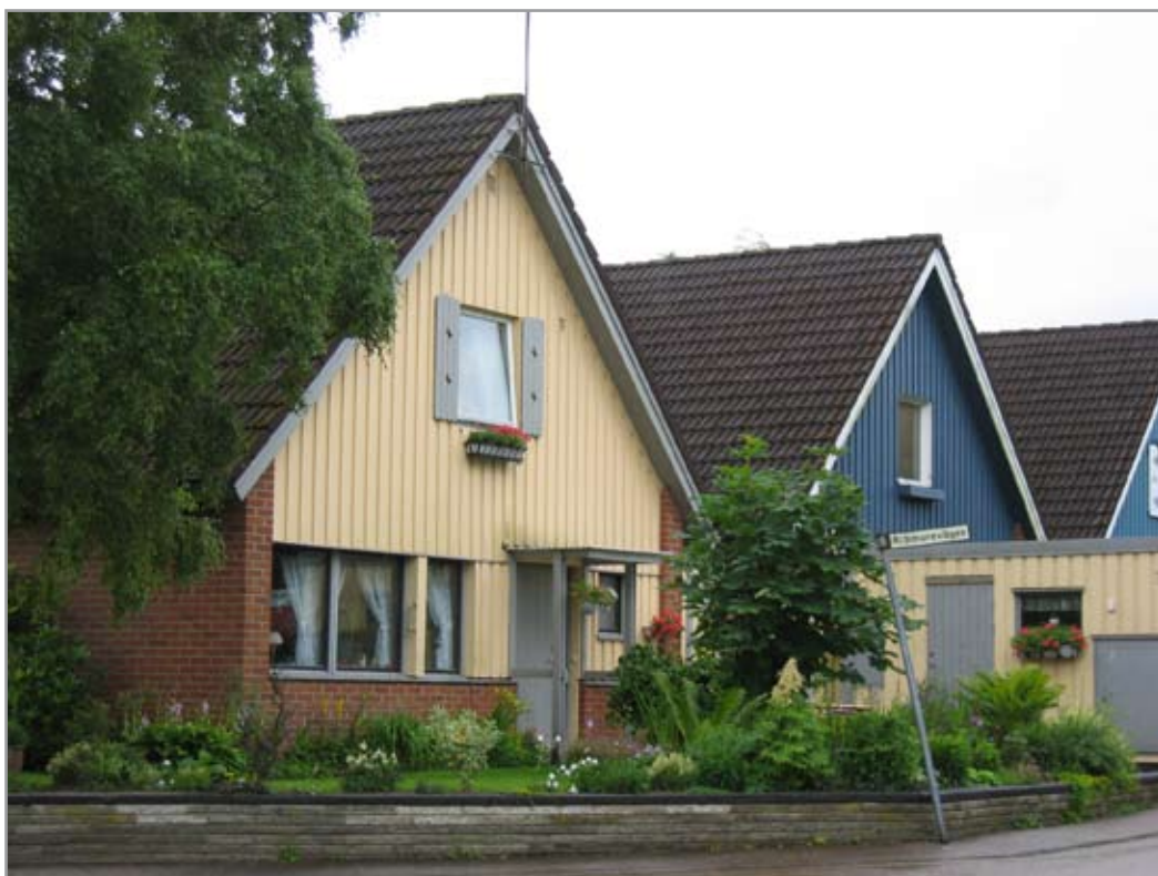
Rimmarevägen 28 - 26.

I anslutning till bostadshusen uppfördes fristående garagelängor.