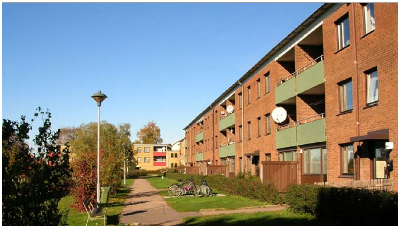
Tröingebergsvägen från sydöst.

Husen har gula och röda tegelfasader och flacka sadeltak. Fönstren består av en luft samt ventilationsruta. Bågar och karmar är målade mörkt bruna. Balkongfronterna som ligger i liv med fasaden består av röd och grön korrugerad plåt. Parkeringsplatser och garage ligger i anslutning till bostadshusen.