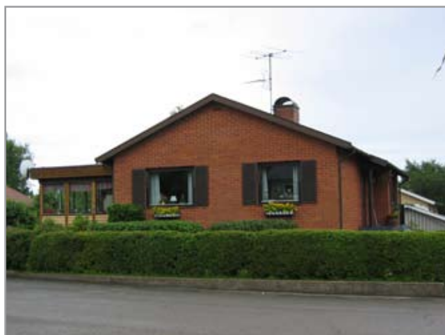
Vidablicksvägen, Tröinge 4:63.