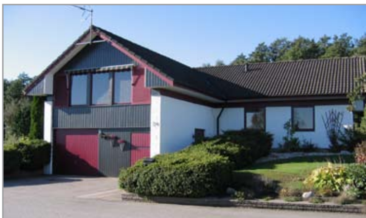
Hagmarksvägen, norra sidan.

De låga husen på gatornas södra sidor har en nedsänkt placering i förhållande till gatan. Taken är helt plana. Arkitekturen betonas av lodräta och vågräta linjer. Fasaderna är vitputsade med inslag av panel. Ut mot gatan ligger en carport.