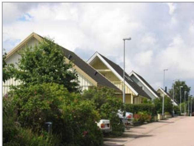
Fru Vinas väg, sydsidan.

Takhöjderna kommer här på samma nivå eftersom 1,5-planshusen ligger på gatornas södra sidor och 1-planshusen på de norra. Nivåskillnaderna längs gatorna upplevs inte som stora. Tomterna är relativt små och villorna ligger tätt. Husen byggdes mellan 1970- och 1990-talen.