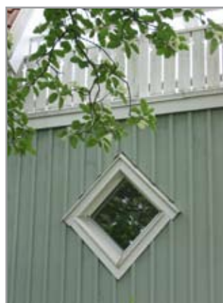
Till vänster: Ormbunken 23, byggt 1932.