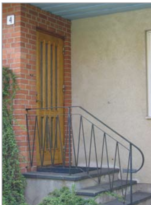
Till vänster: Ormbunken 13.

täckta med tegelpannor. Här återfinns en typisk 1950-talsarkitektur med det särpräglade formspråket vid entréer och balkonger.