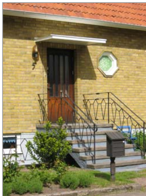
Till höger: Olympen 10.