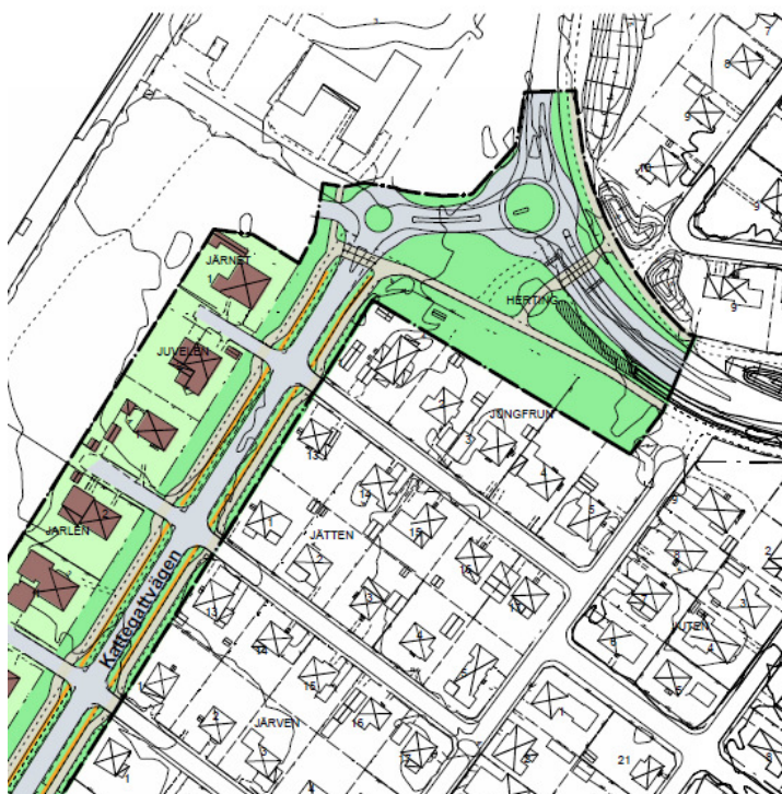
Illustrerade cirkulationsplatser i detaljplaneförslaget