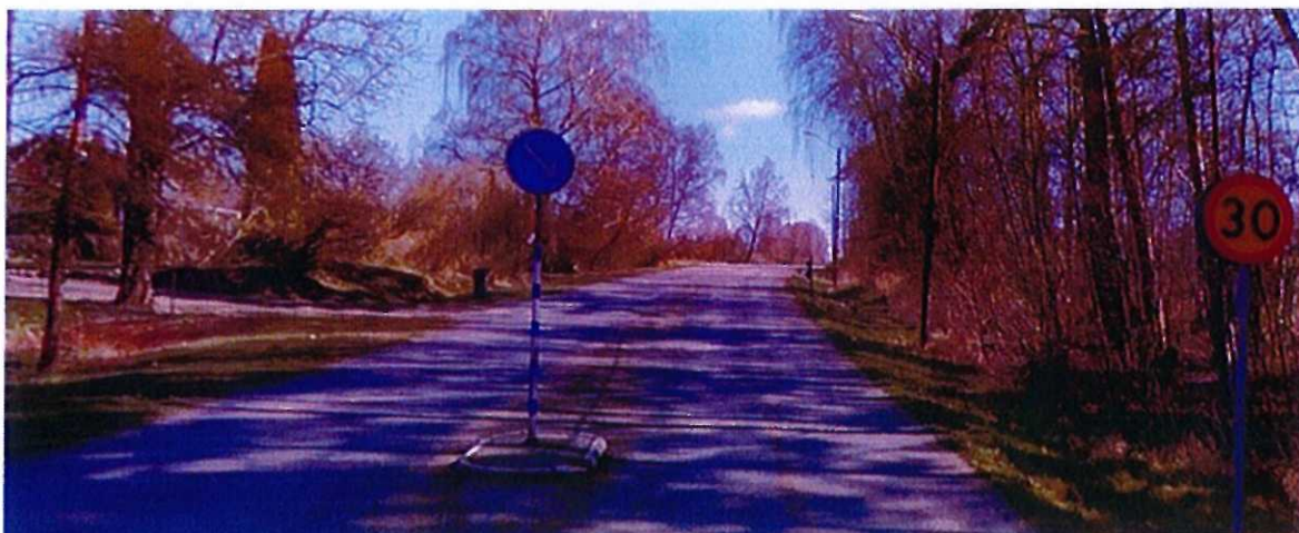
Riktning mot Skrea kyrka