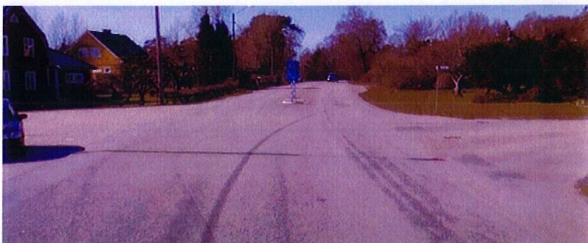
Golfvägen in till höger, riktning från Skrea kyrka