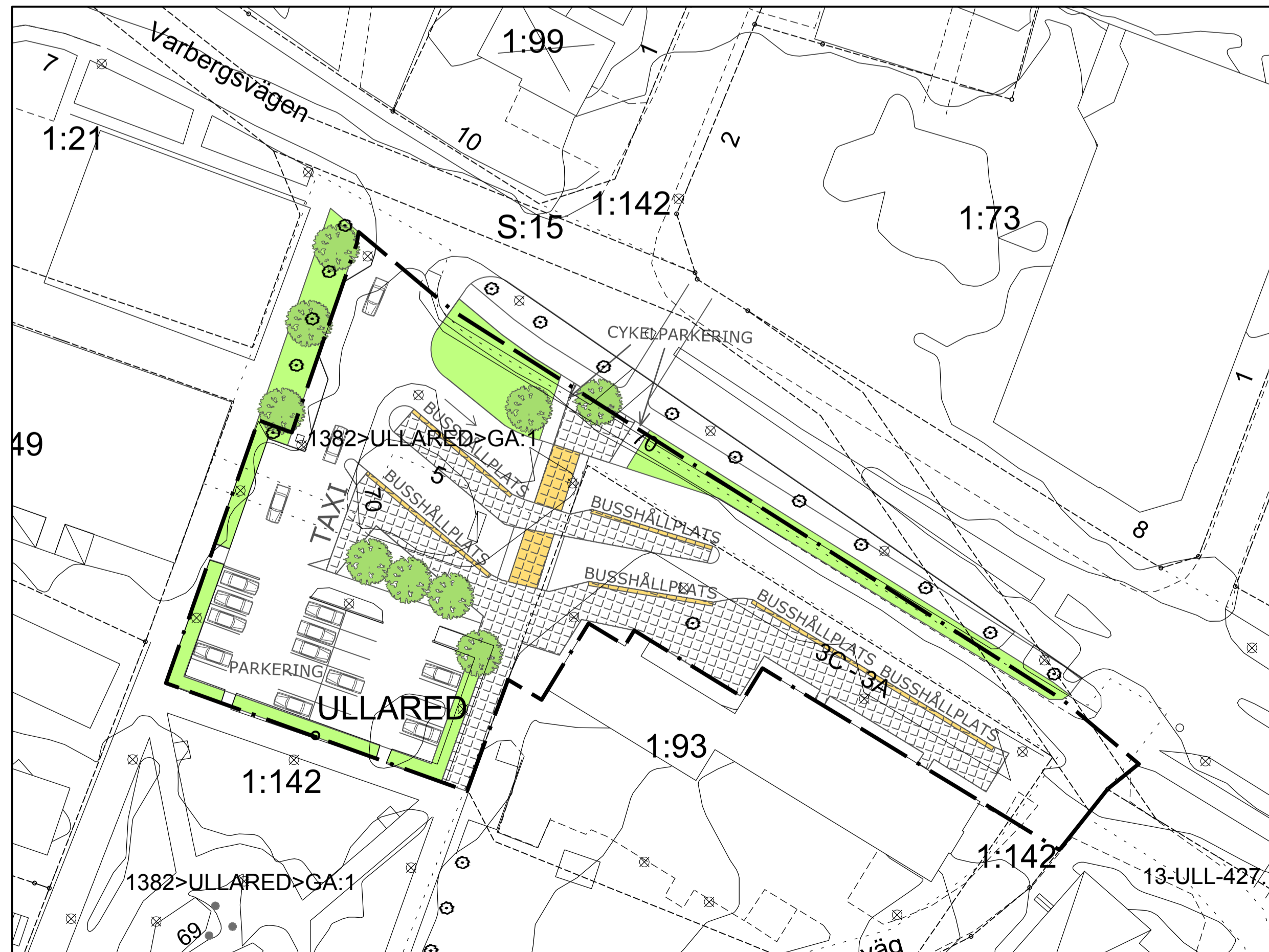
Skala 1:1000 (A3)