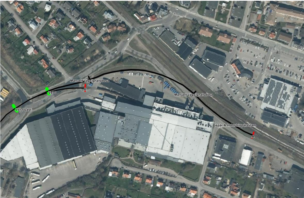
Bilaga 2. Bild på växel till förvaltare Essity Sweden AB