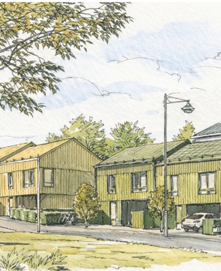
Tätbebyggda radhus, häckar som gränsmarkerare och trädrader längs gatan. Lämpliga trädarter för ändamålet är bland andra lind, körsbär och Ginkgo.