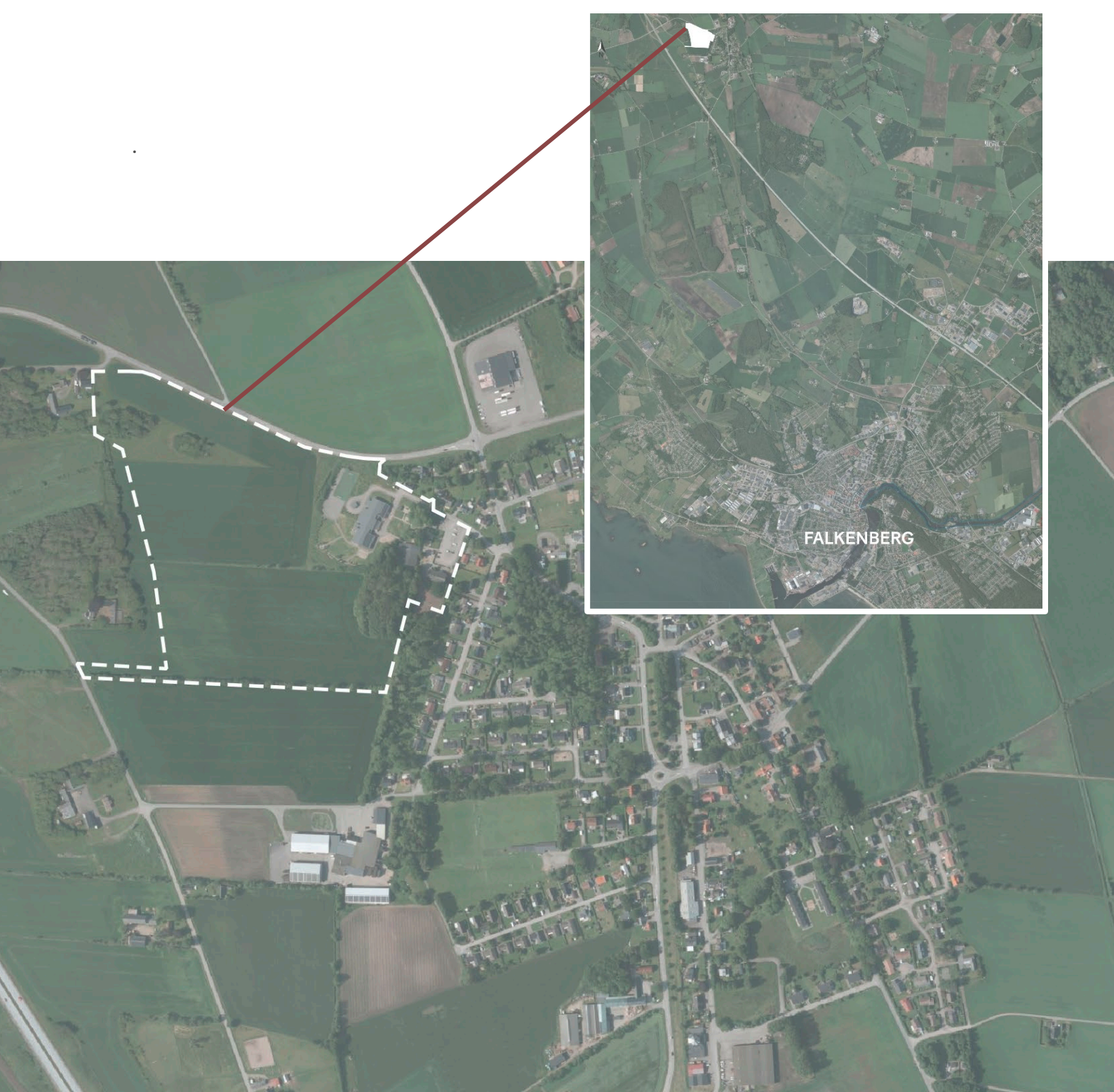
Planområdet, markerat i vitt, i förhållande till Falkenberg och Långås.