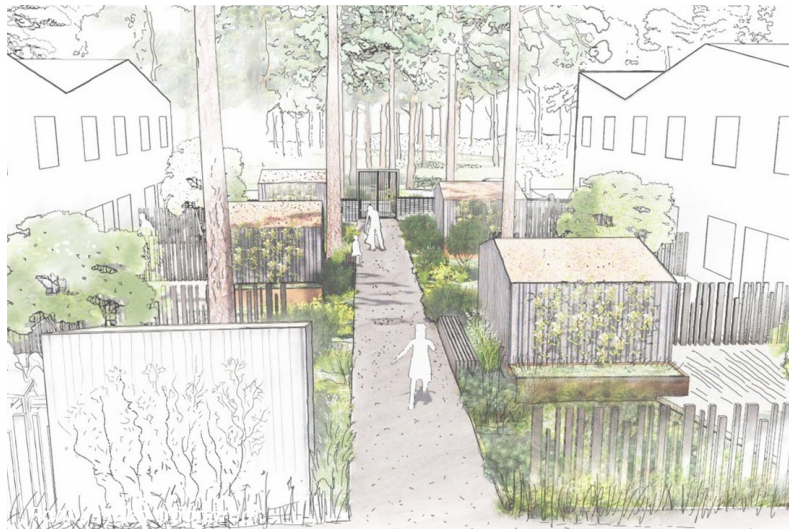
Trädstaden i Kristianstad. Social, småskalig och grön kvartersstruktur.