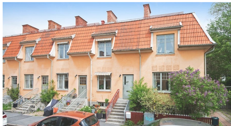
Radhus i Enskede, där ett av Sveriges första trädgårdsstäder byggdes. De små förgårdsmarkerna bidrar till grönska i gaturummet.