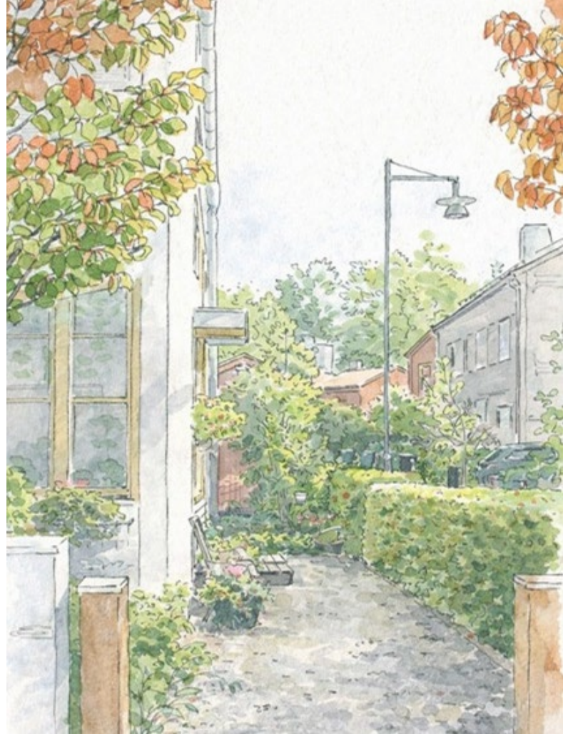
Tullinge trädgårdsstad. Tätbebyggt område med förgårdsmark där häckar fungerar som avgränsare mellan husen.