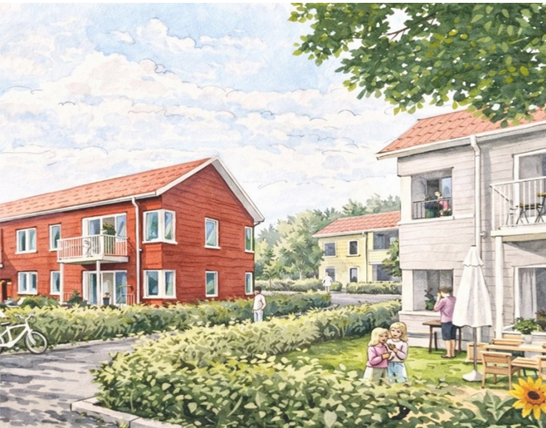
Trädgårdsstaden i Skövde. Flerfamiljehus omgärdat av grönska och smala gator