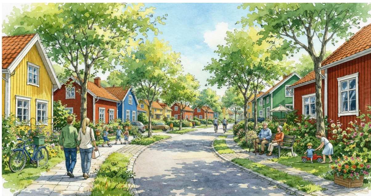
Referensbild på hur gestaltning utifrån trädgårdsstaden kan se ut.

Kommunstyrelsen gav den 16 mars 2021 kommunstyrelseförvaltningen i uppdrag att upprätta ett planförslag med huvudsyfte att pröva förutsättningarna för nya bostäder och utvidgning av skolan inom fastigheterna Långås 2:11 med flera. Fastigheterna ligger väster om samhället och består av privatägd jordbruksmark.