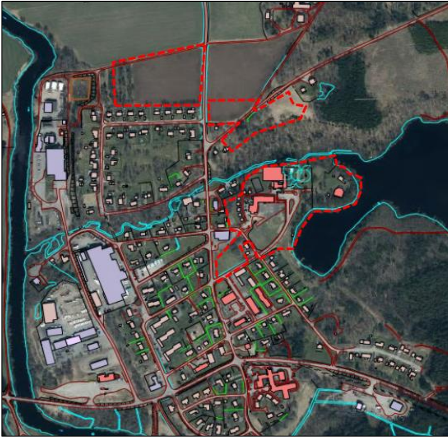
Figur 3: Karta med undersökningsområdet markerat med röd streckad linje. (Falkenbergs kommun, 2024)

I dagsläget består de norra delarna av undersökningsområdet av åkermark, den södra delen består av byggnader bland annat stugor och en skola. Undersökningsområdet redovisas i Figur 3.