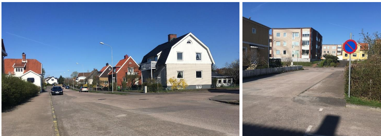
Figur 3 Exempel på förtydliganden och förbud gällande parkering kring planområdet. Markering M22 i korsning Rörbecksgatan-Pilgatan samt vägmärke C35 på Floragatan. Fotodatum 2022-04-26

I planområdets närhet finns gott om parkeringsplatser, på både kvartersmark och allmän plats. Söder om Sandgatan finns parkering till ICA, endast för kunder, max två timmar. Öster om planområdet finns en relativt stor parkeringsanläggning, på Drivbänken 7 som tillhör FABO. En plats med laddstolpe reserveras för hemtjänsten. I övrigt är anläggningen uthyrd och kan därför inte nyttjas av planområdet, om inte nytt avtal tecknas. Längs Rörbecksgatan finns parkeringar i gatumark. I området finns många regleringar och förtydliganden kring parkering, vilket kan tyda på att det finns en stor efterfrågan på parkering.