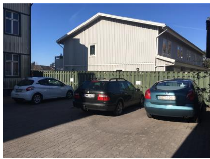
Figur 2 Befintliga bilparkeringsplatser inom Trädgården 16 och Trädgården 8. Fotodatum 2022-04-26

E. Hyrd parkering. 7 platser. Infart från Sandgatan.