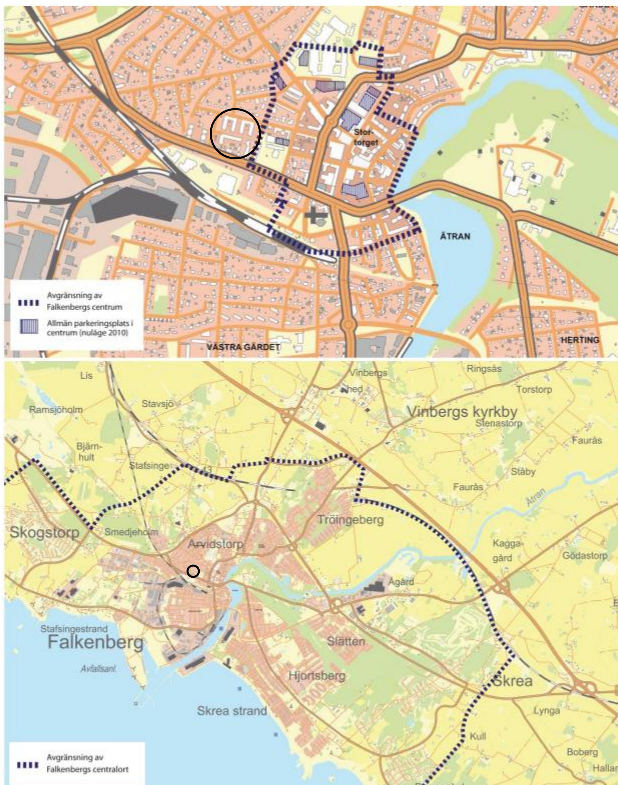
Figur 4 Geografisk indelning som används för Falkenbergs parkeringsnorm. Svart cirkel visar Trädgården 8