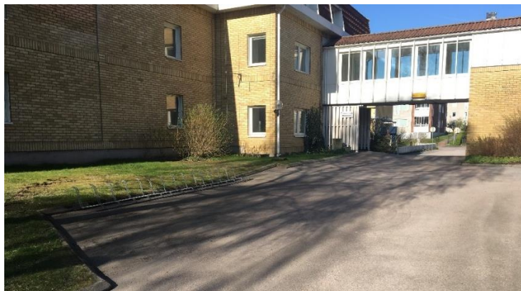
Figur 1 Befintlig cykelparkering på Trädgården 16. Fotodatum 2022-04-26

Vad gäller cykelparkering, finns det 15 platser i mitten av området. Vid platsbesök var dessa tomma, se bild. Det stod dock cyklar på lite andra platser inom fastigheten. Det finns några cykelparkeringar kring de byggnader som ska rivras, i områdets södra del (Trädgården 8). Det finns även parkeringsmöjligheter för cyklar i källarplan och i cykelhus, totalt 25 platser.