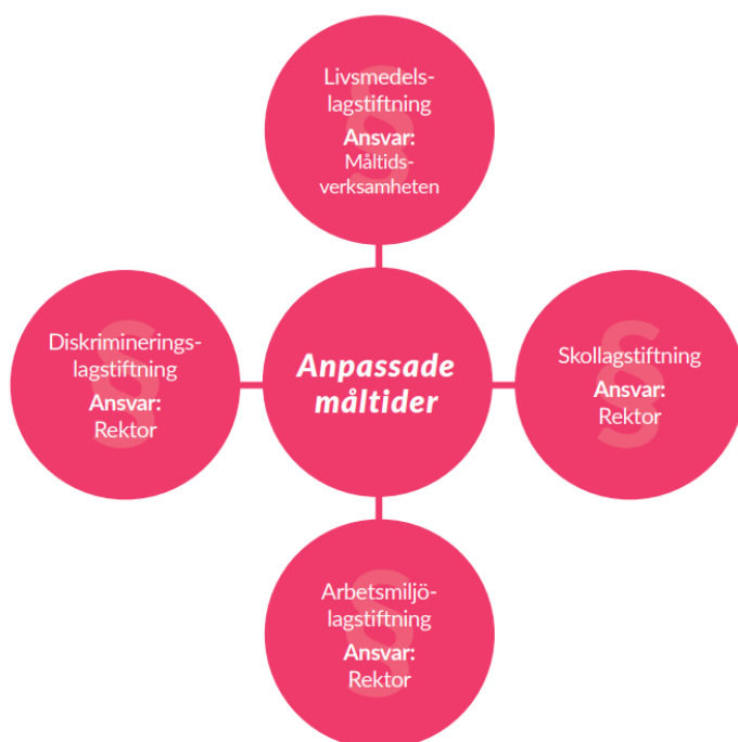
Figur 2: Lagstiftning och ansvar rörande anpassade måltider.