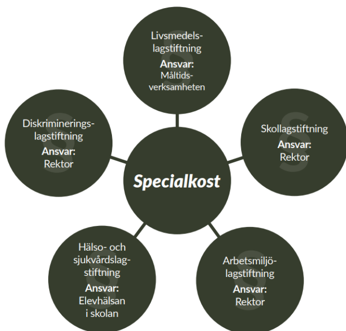
Figur 1: Lagstiftning och ansvar rörande specialkost i förskola och skola.

Nedan följer en schematisk bild över lagstiftning och ansvar rörande specialkost. Det går att läsa mer ingående kring detta i Kost & närings nationella rekommendationer – För hantering av specialkost och anpassade måltider i förskola och skola, 2023.